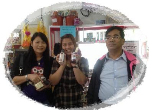
วันที่ 28 – 29 กันยายน 2556 กรรมการ และผู้จัดการ สทกรณฯ เดินทางไปร่วมการศึกษาดูงาน การประชุมใหญ่ สามัญประจำปี 2556 และ การอบรม คณะกรรมการชมรมสทกรณจังหวัดอ่างทอง ณ