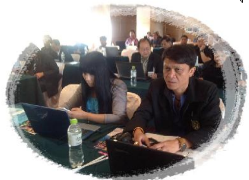
วันที่ 27-28 ตุลาคม 2556 กรรมการ และเจ้าหน้าที่สทกรณฯ เดินทางไปเข้าร่วมฝึกอบรม (CQA) ณ โรงแรมวารี อโยธยา คอร์เวชั่น รีสอร์ท จ.พระนครศรีอยุธยา